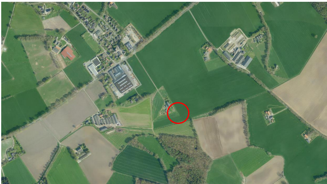
Plangebied in het cultuurlandschap

Het plangebied ligt in het buitengebied van de gemeente Aalten, ten zuidoosten van de kern IJzerlo en vlakbij de Duitse Grens. Er is hier sprake van een open agrarisch cultuurlandschap.