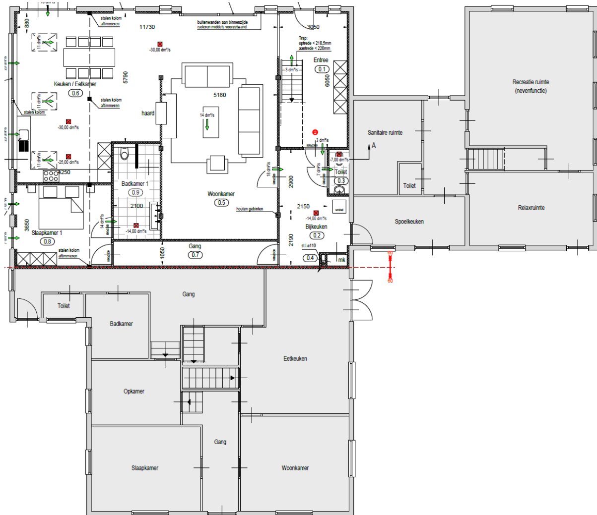
Gewijzigde begane grond

De bestaande woning in het voorhuis zal gebruik maken van het voorste deel van de te behouden berging en de nieuwe woning in het achterhuis krijgt de aangebouwde ruimte met het achterste deel van voornoemde berging.