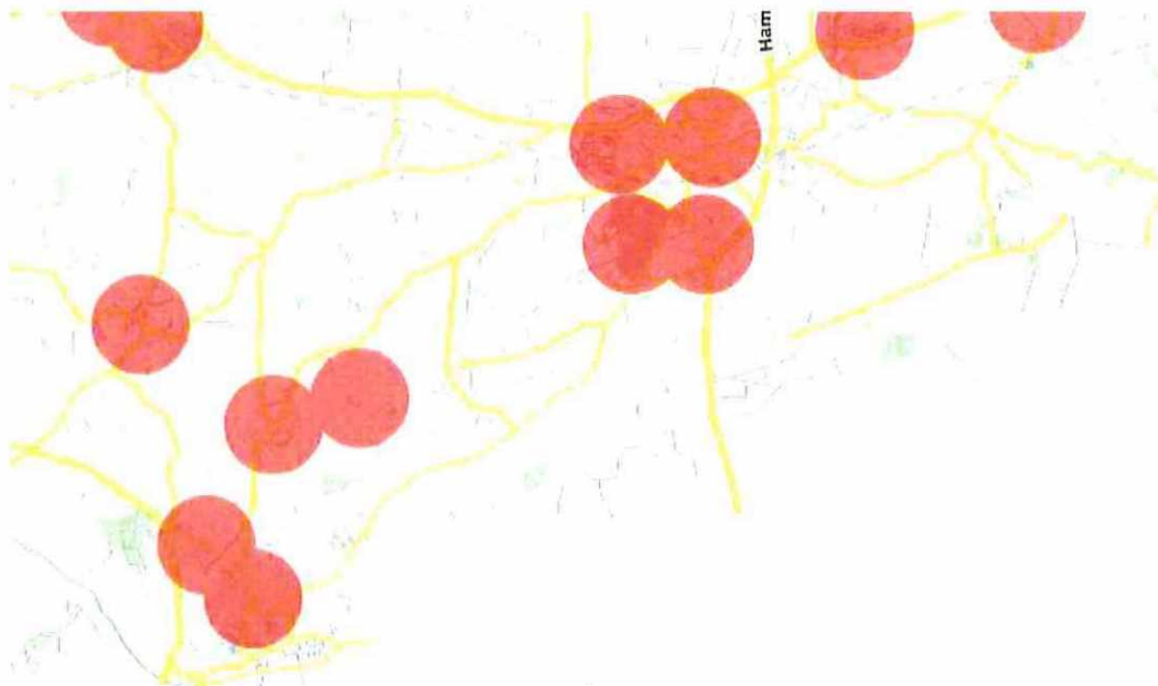
Bereik WAS-palen (roze cirkels)

De meeste deelplannen vallen buiten het bereik van de bestaande WAS-palen (zie afbeelding 1).