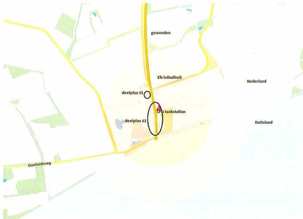
1% letaliteit en gewonden en opzichte LPG-Tankstation

De plannen liggen in het invloedsgebied van een LPG-tankstation. Het LPG-tankstation maakt zelf deel uit van deelplan 12. Om te voldoen aan de eisen uit het Bevi en het Revi (regeling externe veiligheid inrichtingen) wordt het vulpunt van het tankstation verplaatst en wordt het gebruik van het overdekte terras beëindigd. Daarnaast wordt het bedrijf Dibella met 415 m 2 uitgebreid en wordt een nieuwe Truckstop gecreëerd. Door het verplaatsen van het vulpunt bedraagt de afstand tot de uitbreiding en de Truckshop ongeveer 80 meter. De doorzet van het LPG-tankstation is begrenst op maximaal 1000 m 3 per jaar. Door deze afstanden te hanteren wordt ruimschoots voldaan aan de afstanden voor de 10 -6 contour uit het Bevi en Revi.