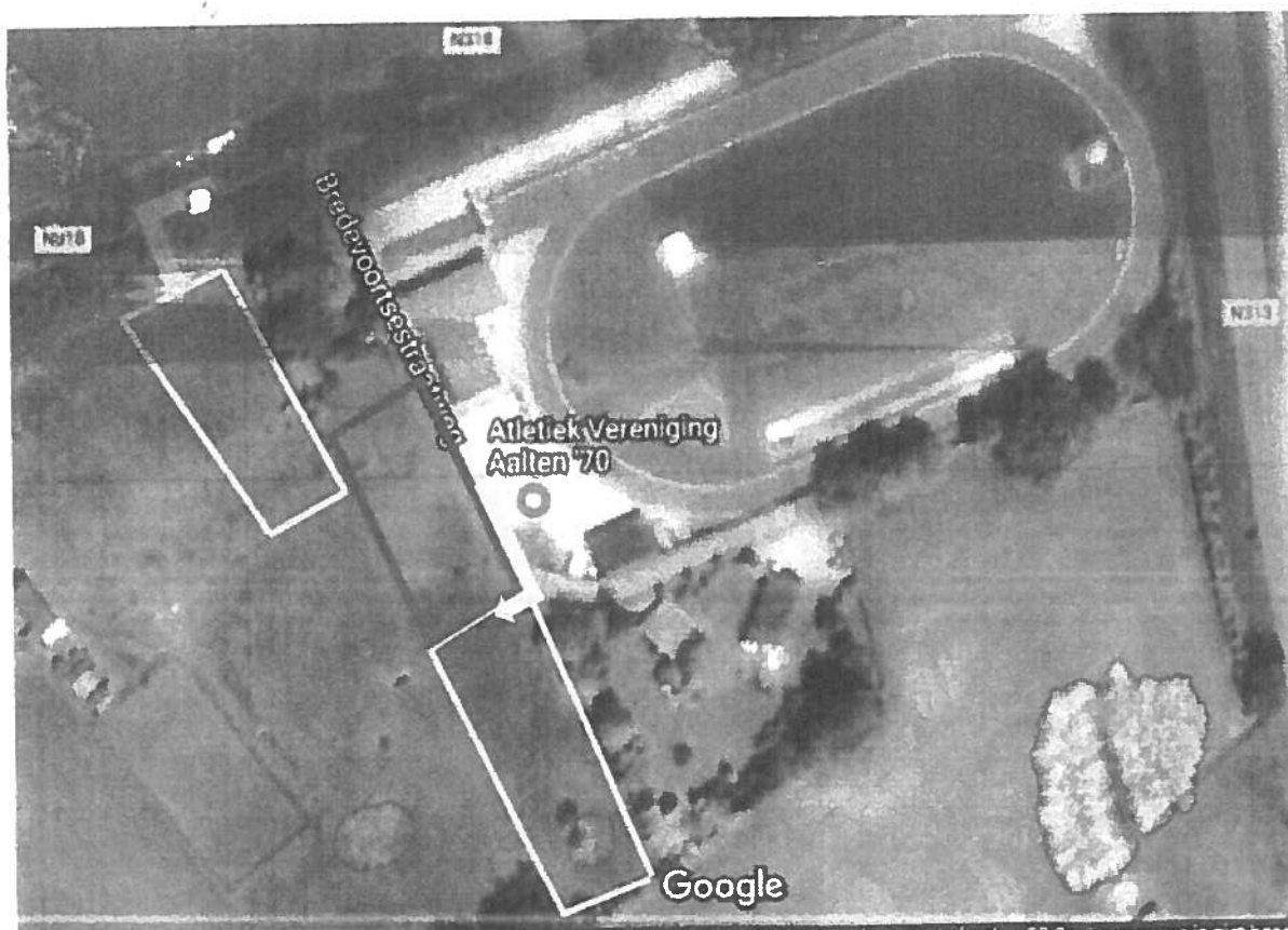
Figuur 1: AVA'70 locatie. Blauw: actuele entree naar weiland Essink Geel: entree naar weiland Bouwmeester bij evenementen Rood: door AVA vrij te gebruiken grondgebied