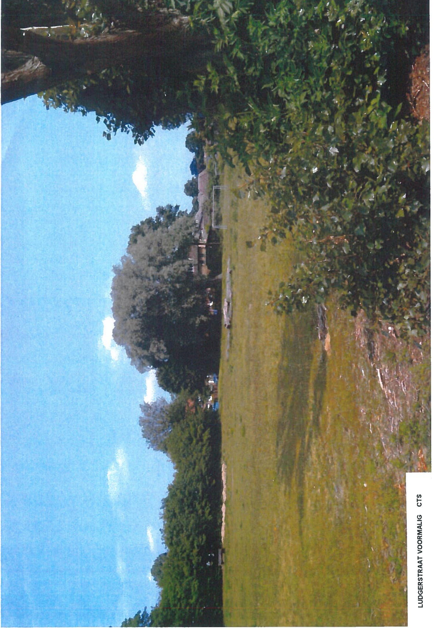
LUDGERSTRAAT VOORMALIG CTS