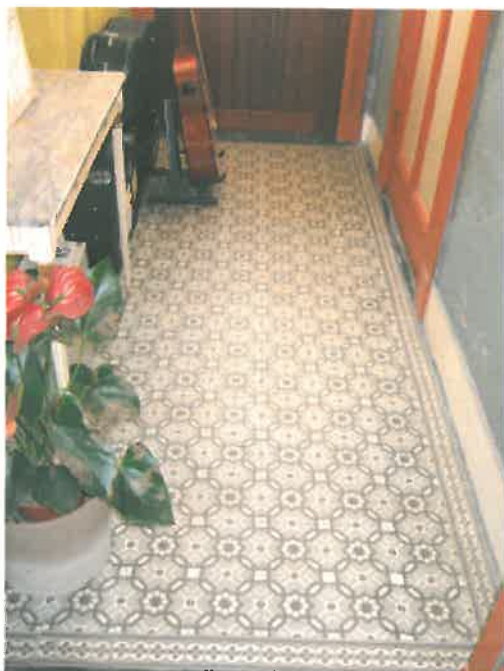
Tegelvloer in de gang