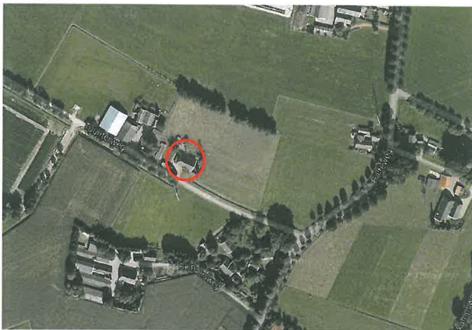
Luchtfoto van het boerderijcomplex. De boerderij is rood omcirkeld.