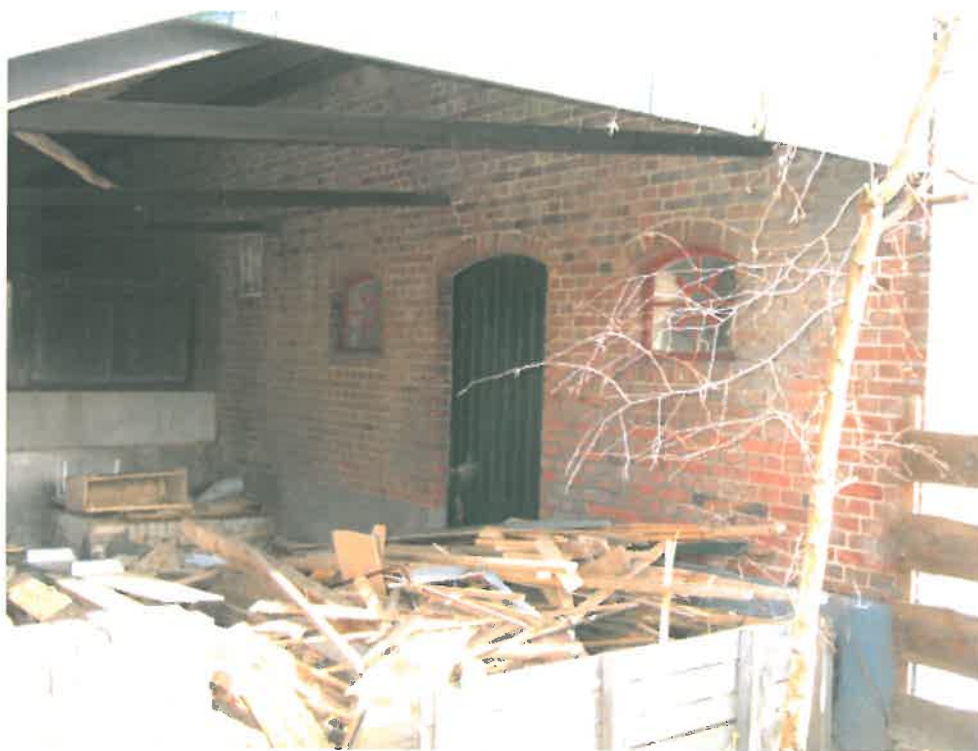
Achtergevel, staldeur en -ramen op de begane grond