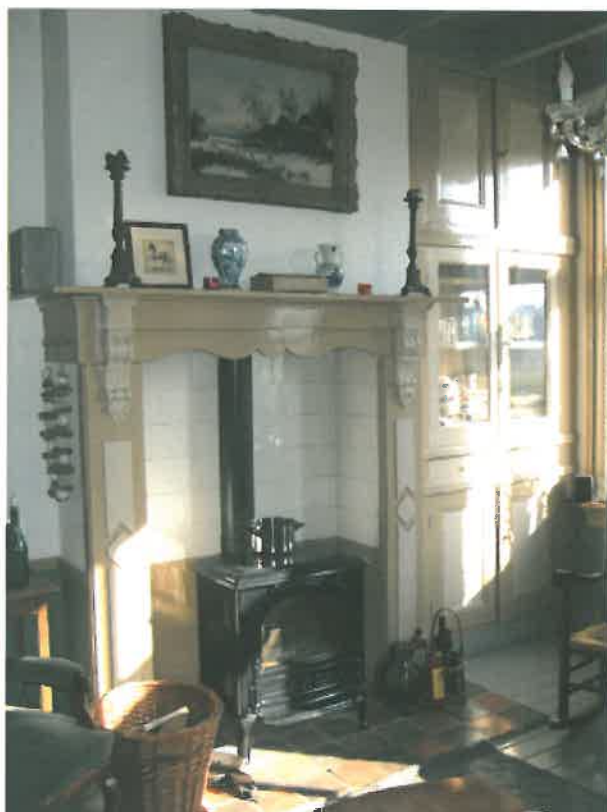
Schouw in de woonkamer met (servies)kast rechts ervan