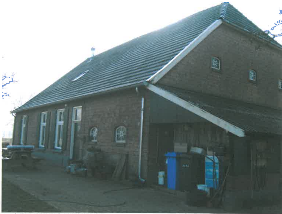
Rechter zijgevel, achtergevel