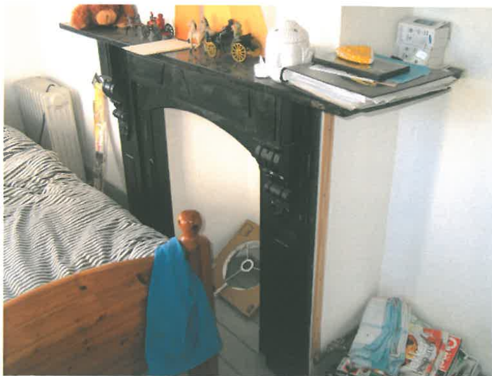
Houten schouw slaapkamer