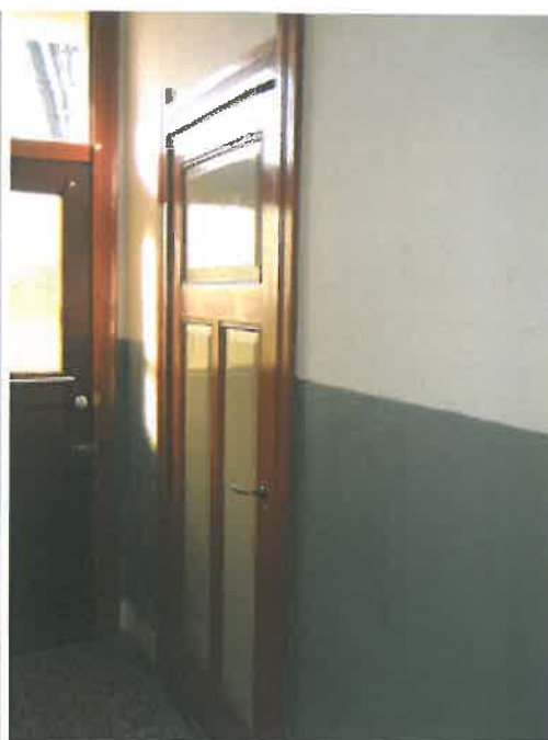
Paneeldeur in de gang