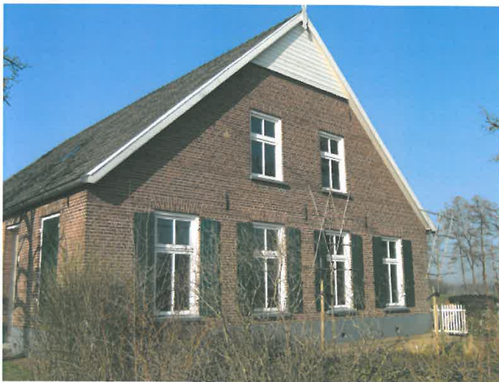
Het voormalige boerderijcomplex aan de Tuunterweg in het buitengebied van Aalten