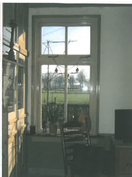
Servieskast rechts naast schuur