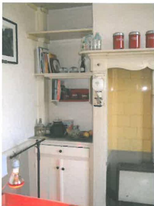
Kast links naast schouw